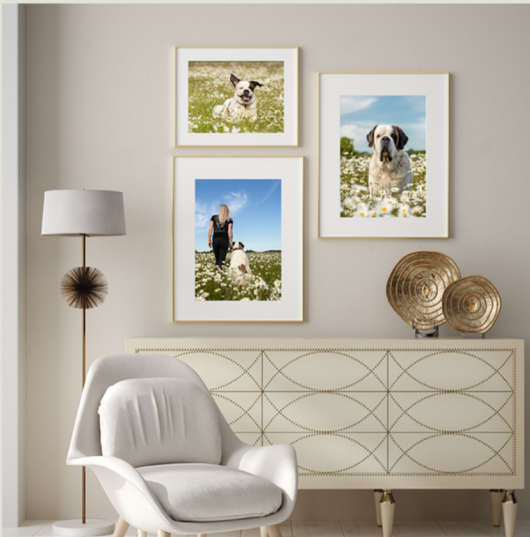
Fotoabzüge im Bilderrahmen mit Passpartout

Denken Sie bereits vor unserem Shooting darüber nach, wie Sie Ihre Bilder präsentieren möchten. Ich biete Ihnen eine große Auswahl an verschiedensten Produkten, Größen, Materialien und Formen an. Teilen Sie mir im Vorfeld mit, ob Sie ein großes Wandbild möchten oder doch lieber ein Fine Art Album, in dem all Ihre Lieblingsbilder Platz finden. So kann ich bereits während des Fotografierens besser auf Bildschnitt, Format und Farben achten.