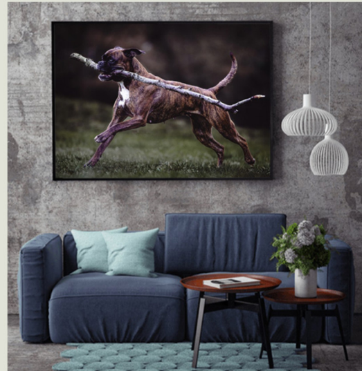
Leinwand mit Schattenfugenrahmen